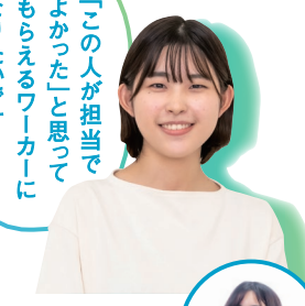
Rさん 安佐南区役所 厚生部 生活課 広島文教大学人間科学部 人間福祉学科卒 Vol.4 当番