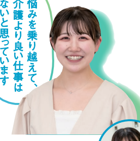
Aさん 社会福祉法人 和楽会 特別養護老人ホーム 和楽荘 トリニティカレッジ広島医療福祉 専門学校 介護福祉学科卒 Vol.4 当番