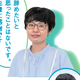
Sさん 社会福祉法人 江能福祉会 特別養護老人ホーム 江能 広島国際医療福祉専門学校 人間総合福祉学科卒 Vol.4 当番