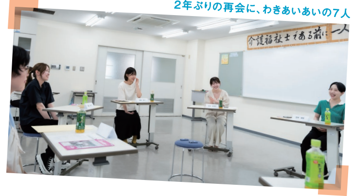
2年ぶりの再会に、わきあいの7人

Gentle vol.4 (2021年発行)内のクロストーク「わたしたちが選んだ『介護』の理由」にて、当時介護を勉強する学生だった5人が福祉・介護の仕事を目指すきっかけや将来の夢を語り合いました。いまは社会人となった彼女たちに再集結してもらい、仕事のことや、リアルな気持ちをお聴きしました。そんな同窓会の一部をお届けします。